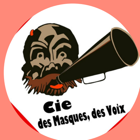
COMPAGNIE DES MASQUES, DES VOIX